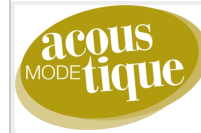
Saint-André en Mode acoustique