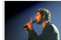
Les grands espaces d'AaRON