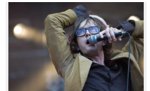
Le retour de Pulp