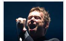
Damon Albarn dans un groupe avec Tony Allen et Flea