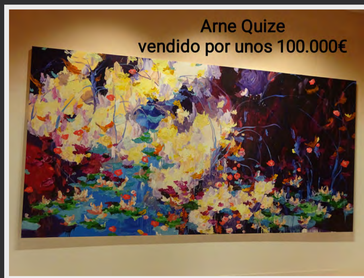
Pintura de Arne Quinze expuesta en Maruani Mercier y vendida.

Optimismo e ilusión eran las dos palabras que más se escuchaban el viernes pasado por los stands de BRAFA. Tanto los galeristas habituales de esta longeva feria belga como los participantes noveles se mostraban entusiasmados de poder regresar al contacto directo con los coleccionistas. Estos acudieron a la nueva sede de Expo Brussels en Heysel para asistir a la 67ª edición y reencontrarse con esos potenciales tesoros con los que regresar a su casa (clásicos o contemporáneos; pintados, esculpidos, tallados o dibujados, tal es la diversidad de piezas que se ofrece).