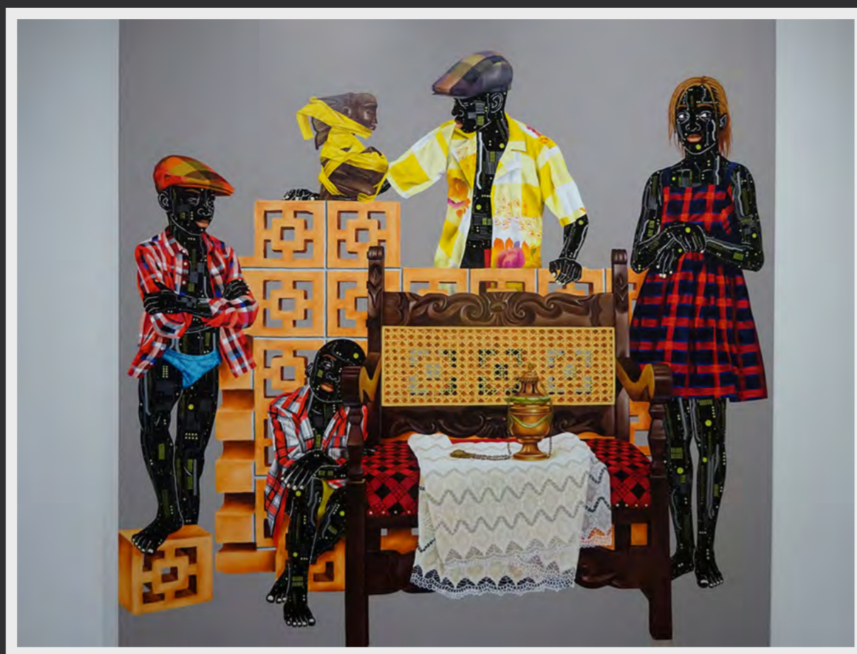
Obra de Eddy Mumaunga expuesta en Zidoun-Bossuyt y vendida.