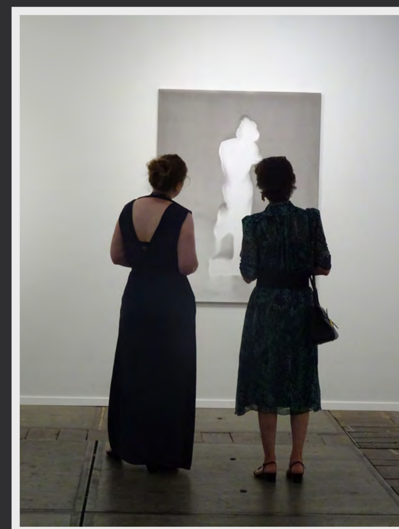
Dos mujeres frente a una obra abstracta en BRAFA 2022.

¿Y qué pasa con las obras millonarias, las más caras de la feria? De momento solo hay silencio. Tendremos que esperar hasta el domingo para saber si las piezas de siete cifras: Tony Cragg por 4,45 millones en KNOKKE-HEIST , Pieter Bruegel el Joven en DE JONCKHEERE y FLORENCE DE VOLDERE por 3-4 millones, o el Basquiat de 7,66 millones encuentran comprador. Sol G. Moreno