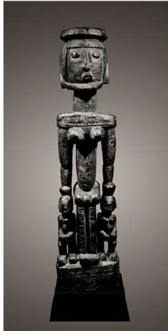
Figure androgyne Dogon, en bois, Mali, 1406-1512 Galerie Dalton Somaré (Milan)